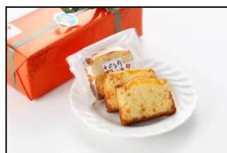
伊東ネーブルのパウンド