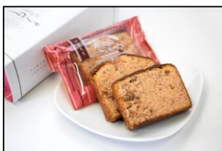
やまもちパウンドケーキ