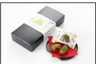
みかんまんじゅう