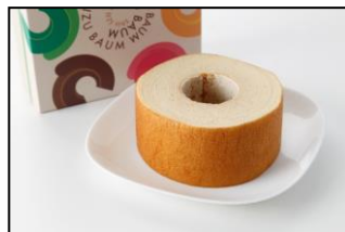
Tish izu バウム