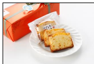
伊東ネーブルのパウンド